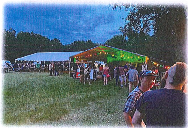
Festival des Gorges Hurlantes