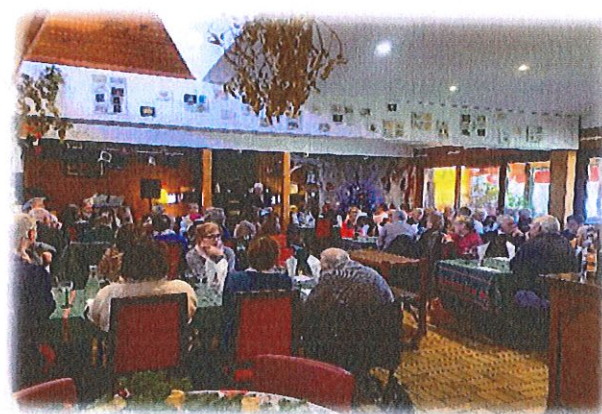
Repas des aînés