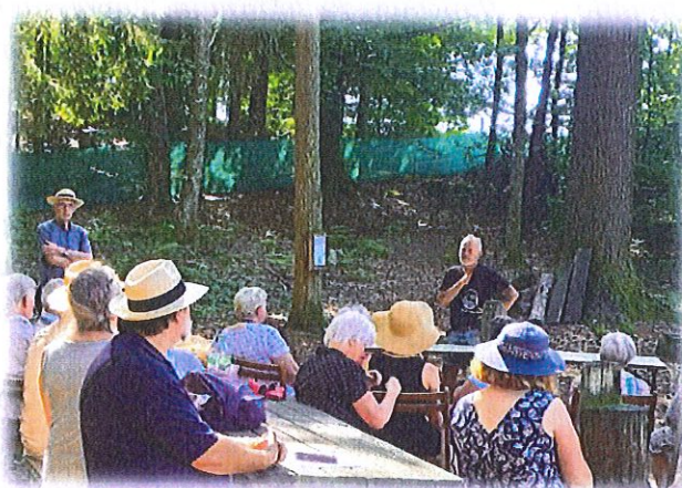
Histoire de passage le 15 juillet