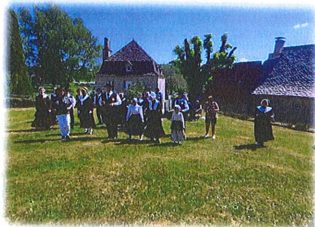
Les échos Limousin le 8 mai