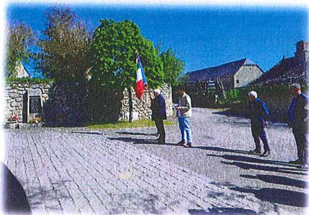
Cérémonie du 8 mai à St Mathurin